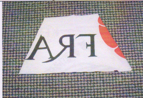
6 - Voici le résultat