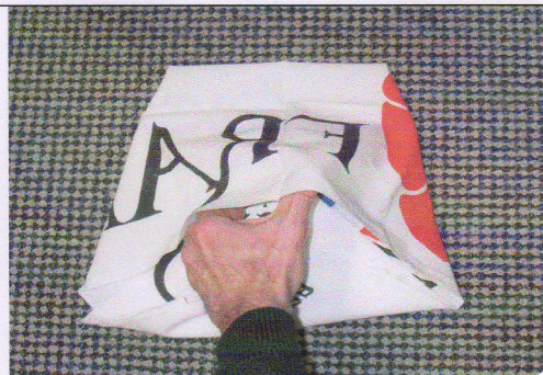
5 - Replier la pointe et l'engager sous cette épaisseur