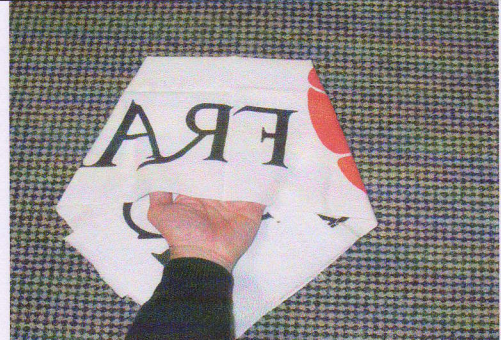
4 - Retourner précautionneusement l'ensemble et soulever une épaisseur de tissu