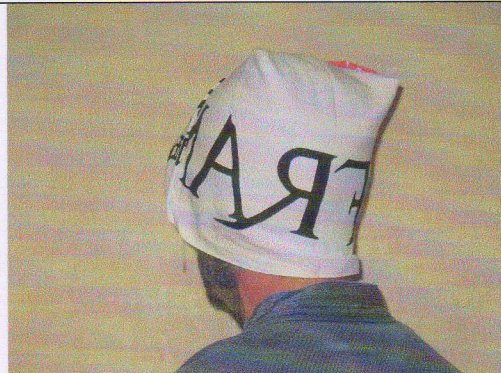
8 - Une seule épaisseur de tissu sur la nuque.

NB : Ceci n'est qu'une des multiples façons de mettre son tenugui. Elle est rapide, facile, le pliage peut être réalisé à l'avance.