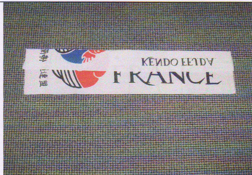
1 - Replier 1/3 env. de la largeur du tenugui