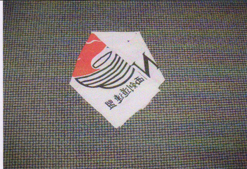
3 - Rabattre le deuxième côté